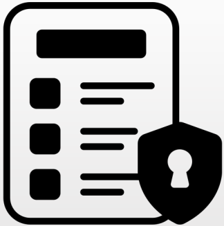
Interne privacy policy